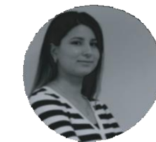
Thilleli Guaouaoui Architecte / Consultante CAO/ DAO/BIM